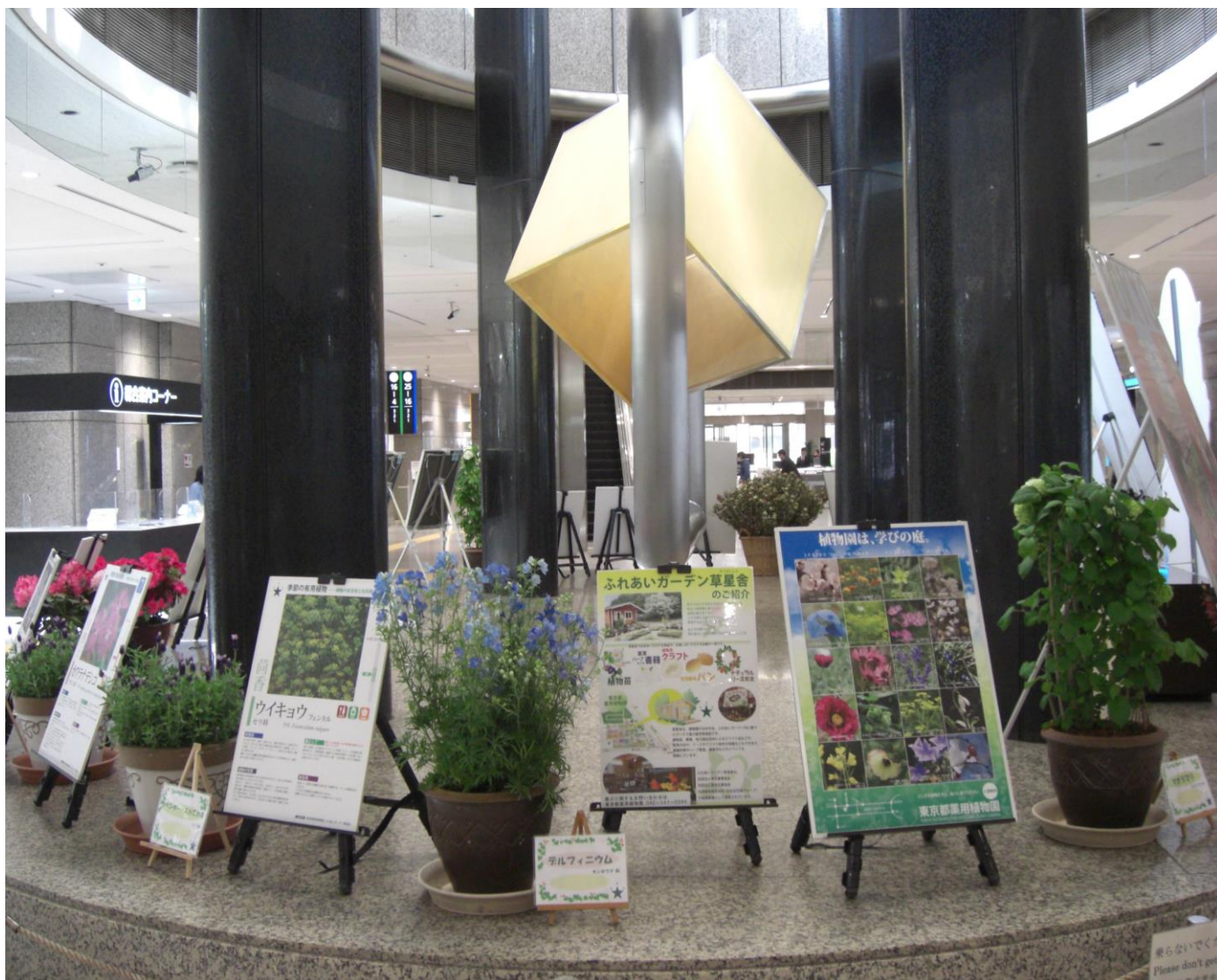
2019年4月東京都庁第一庁舎1階ロビーに展示された「ふれあいガーデン草星舎」のアートワーク展