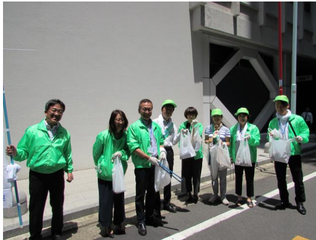
クリーンデーに参加していただいた皆さま